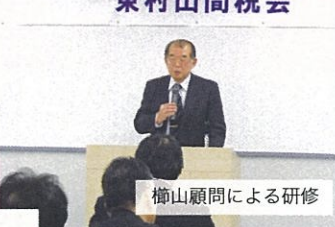
榎山顧問による研修