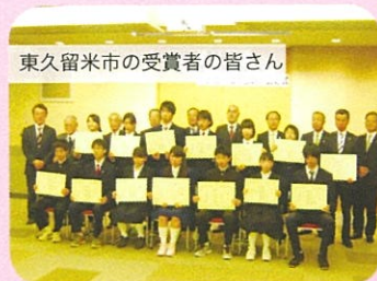
東久留米市の受賞者の皆さん