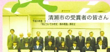
清瀬市の受賞者の皆さん