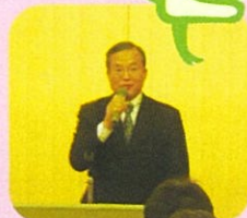
東村山税務署 齋藤署長挨拶