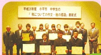
小平市の受賞者の皆さん