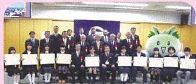
東村山市の受賞者の皆さん