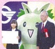
ヒガッシーと共に