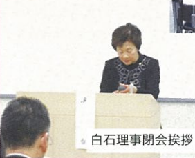
白石理事閉会挨拶