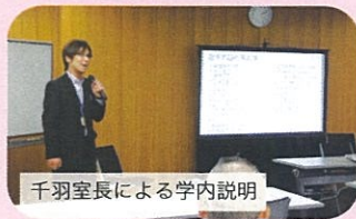
千羽室長による学内説明