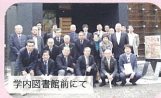
学内図書館前にて